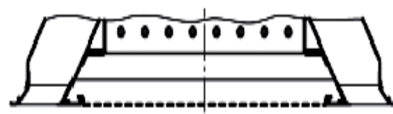
Stropná indukčná výustka DISA 600-LB

Montáž sa môže realizovať do stropov alebo aj voľným zavesením pod stropmi. S dvoma mriežkovými variantmi je možné špecifické optické usporiadanie. Rôzne konfiguračné varianty stropnej indukčnej výustky umožňujú prispôbenie na jestvujúce klimatizačné zariadenie.